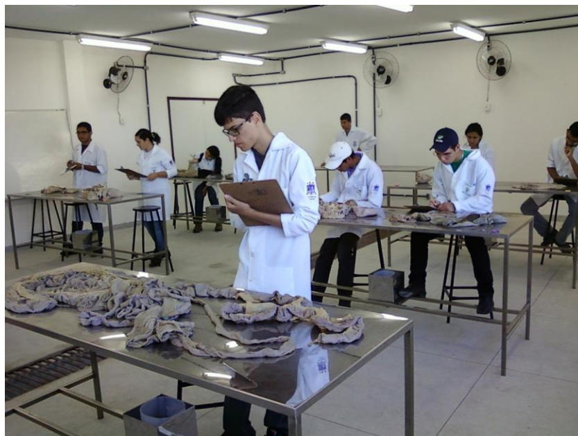
Figura 06 - Primeira atividade da disciplina de Anatomia Descritiva dos Animais Domésticos do curso de Medicina Veterinária na Sala de Aula do Setor de Anatomia do Laboratório de Anatomia e Patologia Animal.