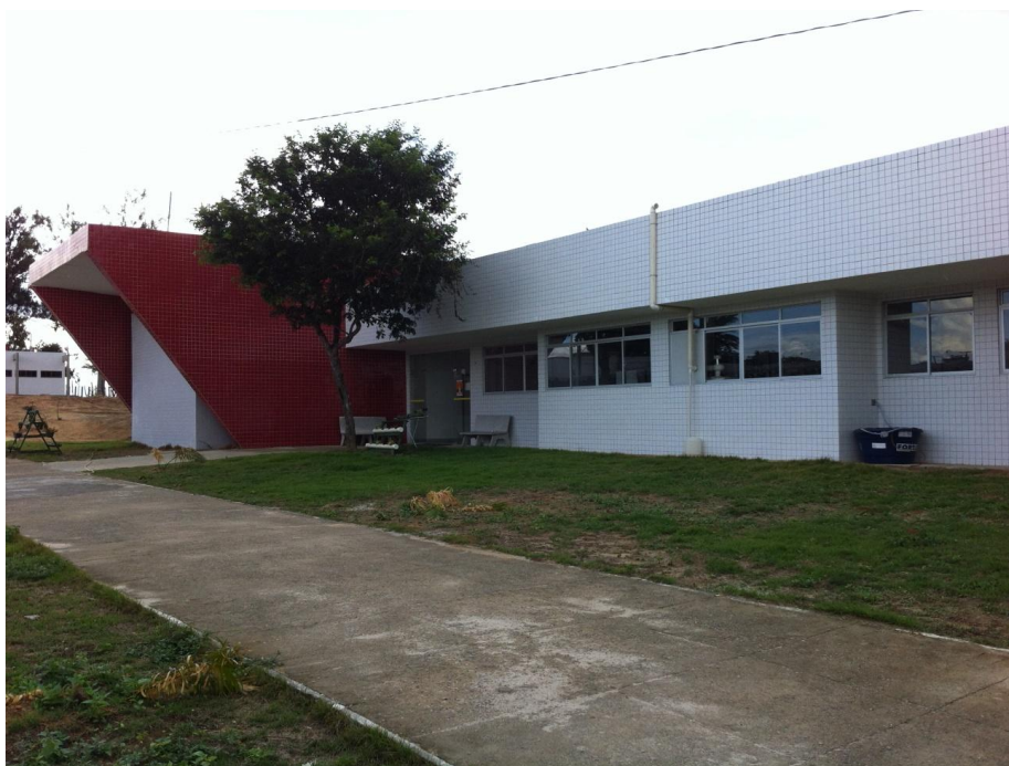
Figura 05 - Fachada do Laboratório de Anatomia e Patologia Animal (UAG/UFRPE)