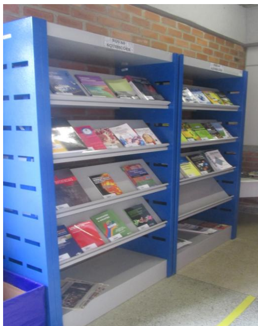
Figura 2: Estantes expositoras de novas aquisições