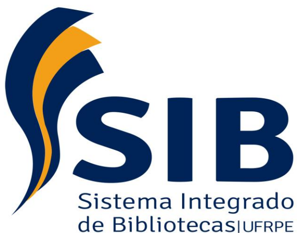
Figura 3: Logomarca do Sistema Integrado de Bibliotecas da UFRPE