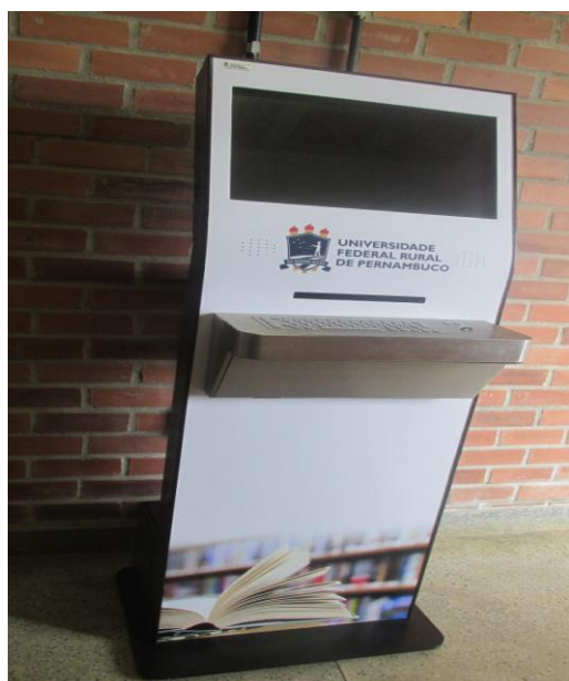
Figura 1: Totem de auto atendimento e consulta